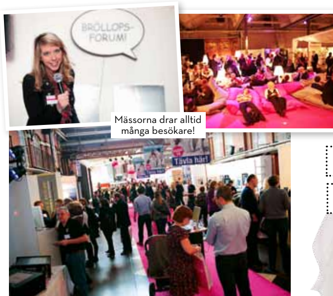
Mässorna drar alltid många besökare!

På våra mässor blir tidningen och sajten verklig. Här har alla brudpar möjligheten att träffa och prata med alla olika bröllopsleverantörer och se klänningar, buketter, tårter och limousiner. Vi är själva på plats för att tipsa och råda besökare inför deras stora dag.